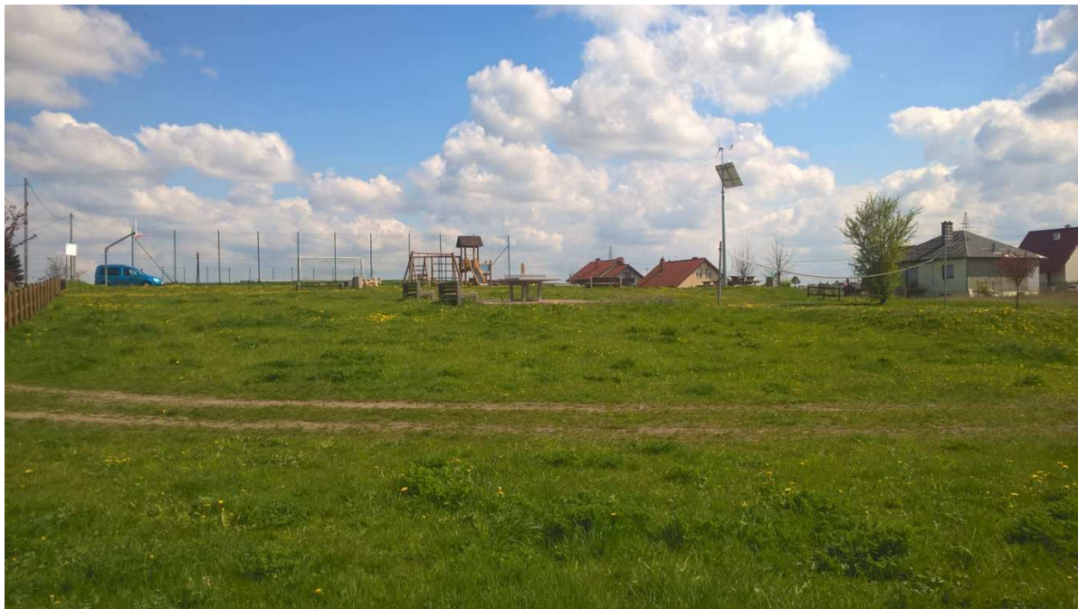
Miejsce projektowanej inwestycji – widok w kierunku wschodnim

Połączenie komunikacyjne z drogą publiczną – działka przylega do pasów drogowych dwóch dróg gminnych.