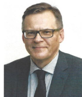
PREZES KASY ROLNICZEGO UBEZPIECZENIA SPOŁECZNEGO