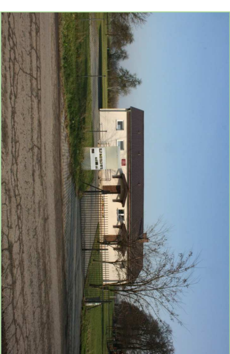
FOTOGRAFIA nr 1